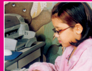
اعداد الصديقة: ياسمين قوماوي